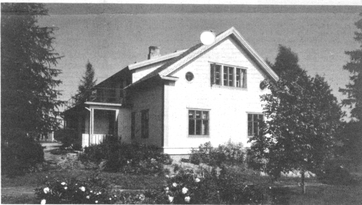
Ns. ökytalo eli Keitelelehdenpohjan Pietilä.