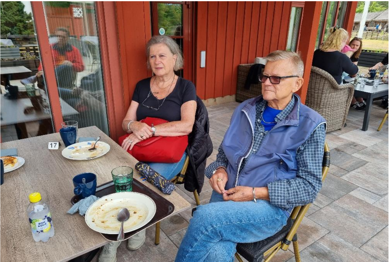
Välillä kahvit ja Ahvenanmaan pannukakkua