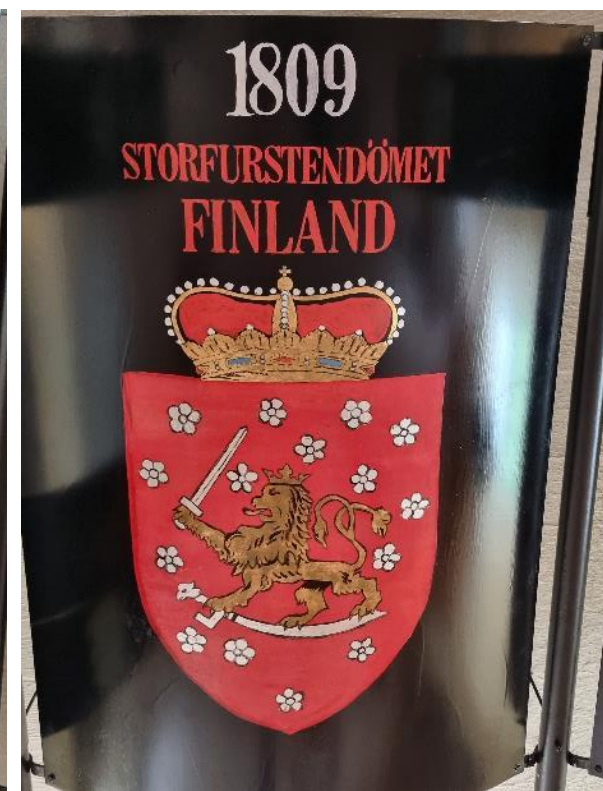
Linnan salissa olleita vaakunoita