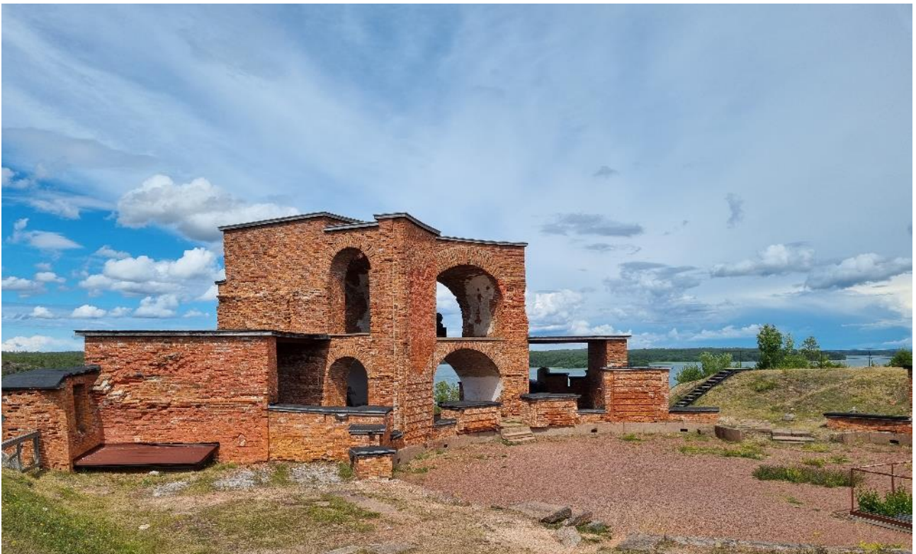
Bomarsundin linnoituksen yksi torni