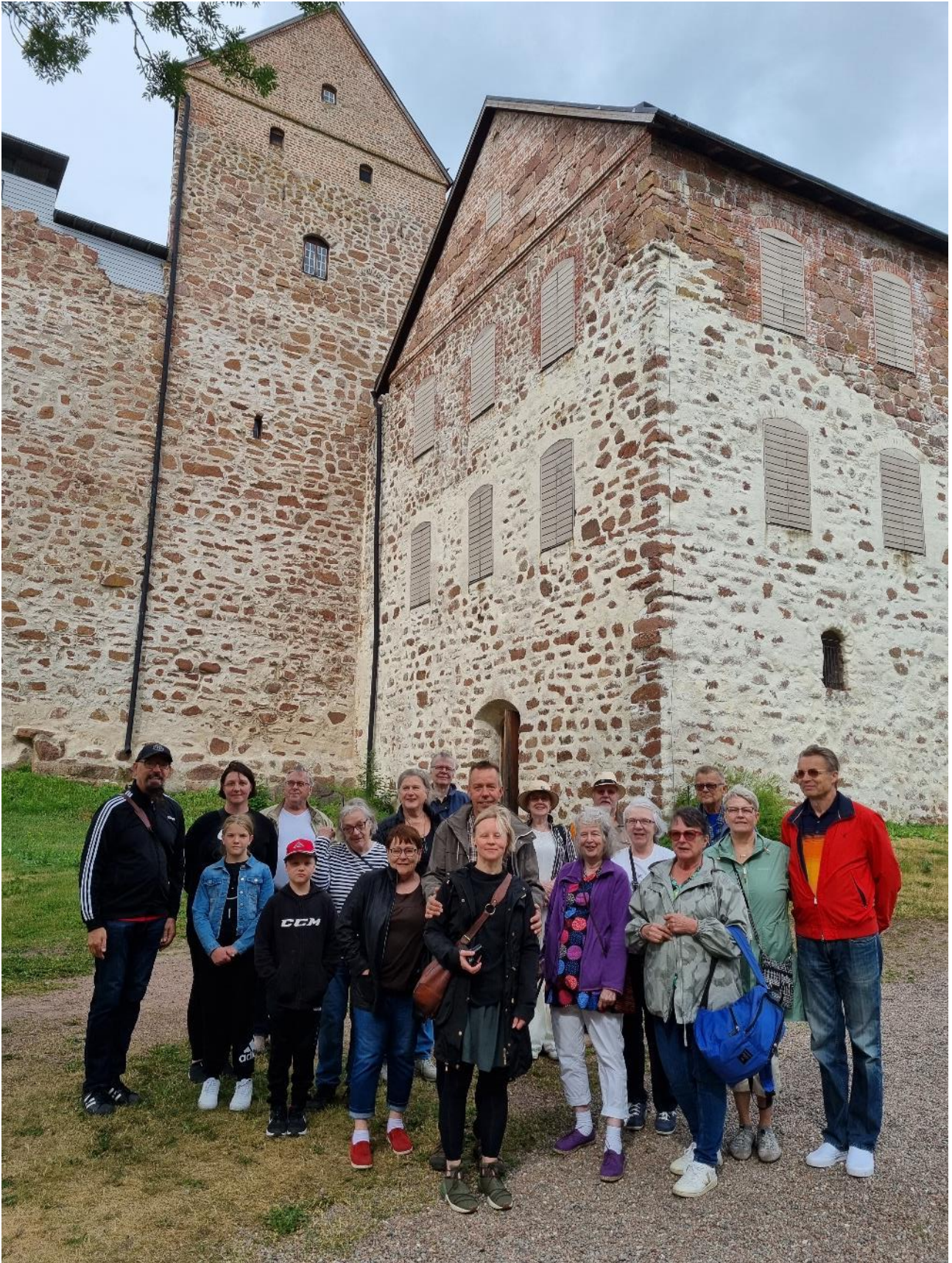
Matkalaiset Kastelholman linnan edustalla

Vesteriset Ahvenanmaalla 8.7. – 10.7.2022