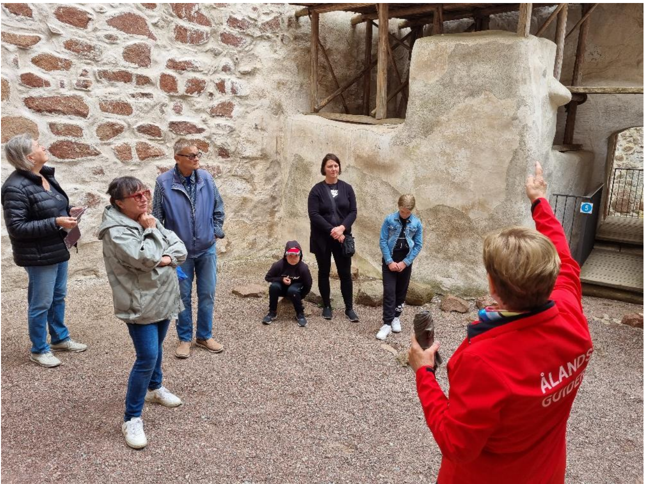
Oppaamme kertoo linnan historiasta